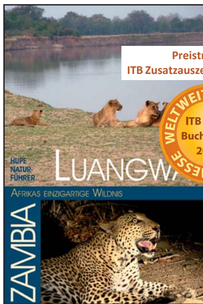
Preisträger ITB Zusatzauszeichnung 2017