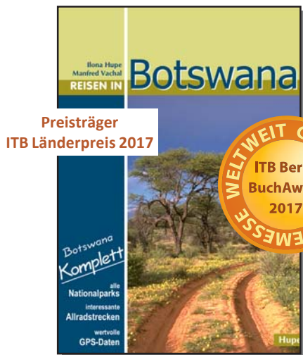
Preisträger ITB Länderpreis 2017