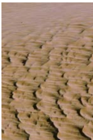
Fotos rechts: Steilküste bei Mughisail; Sicheldünen in der Rub al-Khali; Baum in Ain Ishat im Monsunbereich