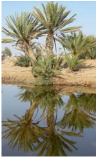
Fotos dieser Seite: Szenerie beim Wadi Shuwaymiyah; Palmen im Wadi Muqshin; Sandverwehungen

Auf seiner Nordseite flacht das Qaragebirge landeinwärts sanft ab, hier strömen die Niederschläge in ausladenden, flachen Wadis in die Wüstenebene, wo sie verdunsten und versickern. Man nennt dies die Nejd-Ebene . Sie erstreckt sich bis zur Zentralarabischen Wüste, die den größten Teil der Arabischen Halbinsel einnimmt und mit 780 000 km 2 größer als Frankreich und die Benelux-Staaten zusammen ist. Im südlichen Bereich der Zentralarabischen Wüste liegt wie eine „Wüste in der Wüste“ die Rub al-Khali , ein 20 000 km 3 riesiger Sandhaufen, die größte geschlossene Sandwüste unseres Planeten. Sie verteilt sich über die Länder Oman, Saudi-Arabien, Vereinigte Arabische Emirate und Jemen. Die Bedu haben diesem lebensfeindlichen Ozean aus Sand mit seinen endlos langen Sandkämmen und Dünen, die bis zu 300 m aufragen, die Namen „ Leeres Viertel “ und „Die Sande“ gegeben. Dhofar besitzt einen großen Anteil an dieser ausgedehnten Sandwüste.