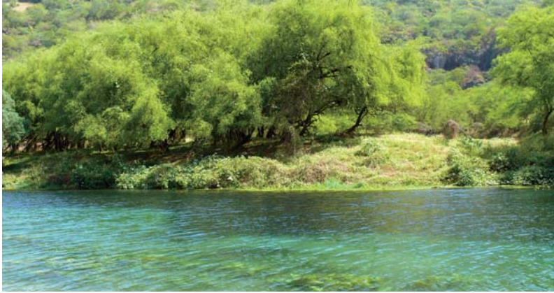
Fotos dieser Seite: Wadi Darbat am Ende der Monsunzeit; Wolkenmassen treffen auf den Jebel Samhan Fotos rechts: Impressionen des besonderen Klimas mit Nebelbänken und üppiger Vegetation