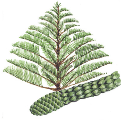
Norfolk Island Pine* Norfolktanne* Zimmertanne* Araucaria heterophylla* ( Araucaria excelsa* )

Klasse: Nacktsamer, Gymnospermae Ordnung: Kiefernartige, Pinales Familie: Araukariengewächse, Araucariaceae Aussehen: Bis 60 m hoher Baum. Der Stamm, in der unteren Hälfte meist astfrei, hat einen Durchmesser bis 8,5 m. Erreicht die volle Größe erst mit 1500 Jahren, Alter bis 4000 Jahre. Der wohl beeindruckendste Baum Neuseelands. Rinde: Braun bis aschgrau, schuppt regelmäßig ab, daher kaum Epiphyten am Stamm. Standort: Nördliche Küstenwälder. Im Waipoua Forest: »Tane Mahuta«, mit 51,5 m der höchste noch lebende Kauri, Alter etwa 2000 Jahre. Blätter: Die «Nadeln» sind eiförmig, mittelgrün, flach, ledrig, bis 4 cm lang und 1 cm breit. Samen: Am gleichen Baum: maiskolbenartige männliche und kugelförmige weibliche Zapfen, mit geflügelten Samen unter den Schuppen. Nutzen: Vielfältig bei Maori: z.B. das Holz zum Kanu- und Hausbau, Kauriharz als Feueranzünder. - Die Europäer nutzten das leichte Holz (u.a. für Schiffe, Häuser, Möbel) und das Harz als Firnis für Lacke und Linoleum bzw. als Kauri-Kopal (Neuseeländischer Bernstein) für Schmuck. Heimat: Neuseeland. Es überlebten nur 4 % der ehemaligen Kauriwälder. Vergleiche: →Queensland-Kauri (Australien). Allgemeines: Siehe →Norfolktanne (Neuseeland).