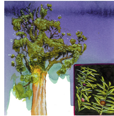
Totara Totara Totara-Steineibe Podocarpus totara

Klasse: Nacktsamer, Gymnospermae Ordnung: Kiefernartige, Pinales Familie: Araukariengewächse, Araucariaceae Aussehen: Immergrüne, kegelförmige Konifere, bis 60 m hoch; Äste sind spiralg angeordnet und leicht aufsteigend, fächerförmiges Blattwerk. Blätter: Nadelartig, 5-10 mm lang, in spiralgiger, schuppenförmiger, um den Zweig herum dicht gedrängter Anordnung. Samen: Zapfen, bis zu 13 cm groß. Samen nur alle 3 Jahre. Heimat: Norfolk Island (zwischen Australien und Neuseeland). Nutzen: Früher beehrter Stamm für Segelschiff-Masten. Heute als salztoleranter Baum häufig an den Küsten Neuseelands angepflanzt, auch weltweit in warm-gemäßigten Regionen. In Mitteleuropa als »Zimmertanne« eine beliebte Topfpflanze. Auch geschätzter Forstbaum. Vergleiche: →Neuseeländischer Kauri-Baum; im Australien-Teil: →Norfolktanne, →Queensland-Kauri, →Bunyatanne, →Hoop-Schmucktanne. Allgemeines: Araukarien (insgesamt 3 Gattungen mit 41 Arten) sind benannt nach dem Ort Arauco in Chile und gelten als »altertümliche« Nadelbäume, u.a. wegen der Nadelstruktur. Als »Gondwanapflanzen« sind sie fast nur auf der Südhalbkugel beheimatet.