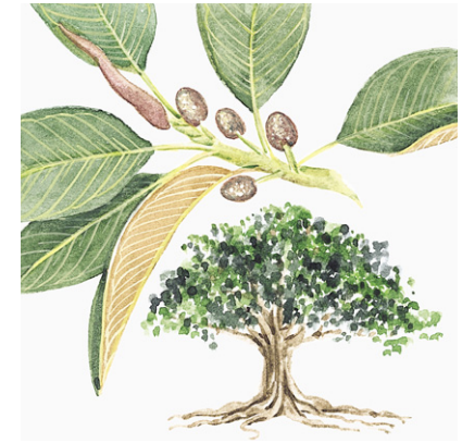
Moreton Bay Fig Tree

Ordnung: Malvenartige, Malvales Familie: Rosenapfelgewächse, Dilleniaceae Aussehen: Im Regenwald ein aufrechter und ausladender und bis zu 20 m hoher Baum, als Zierbaum nur bis zu 8 m hoch. Standort: Bevorzugt die Küstenbereiche von tropischen Regenwäldern und Monsunwäldern. Rinde: Rötlich (Name) und schuppig. Wirtsbaum für aufsitzende Orchideen. Blätter: Bis zu 25 cm lang, oval, dick, lederartig, stark glänzend dunkelgrün. Blüten: Leuchtend gelb, fünfstrahlig, bis zu 8 cm breit, blühen nur einen Tag lang. Blütezeit: Überwiegend Juni bis Juli. Früchte: Kapsel Frucht mit dicker Schale, die aufspringt und 6-8 blütenartige, rote Segmente mit weißen Samen enthüllt. Nutzen: Die Aborigines essen die Samen und das Fruchtfleisch. Mit den erhitzten Blättern werden beispielsweise Speerwunden kuriert. Aus dem ausgehöhlten Stamm stellt man Kanus her. Heimat: Ost- und Nordaustralien. Besonderes: Man sieht recht häufig gleichzeitig die fünfstrahligen gelben Blüten und die meist siebenstrahligen rotweißen »Samenblüten«. Vergleiche: Ähnliche gelbe Blüten: Golden Guinea Flower , Hibbertia -Arten; sowie → Strandeibisch.