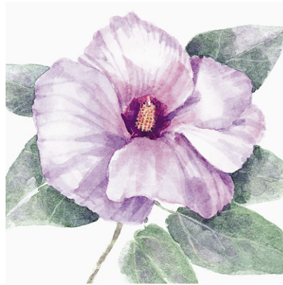
Cotton Rose Bush Australian Cotton Sturt's Desert Rose

Ordnung: Malvenartige, Malvales Familie: Malvengewächse, Malvaceae Aussehen: Immergrüner Strauch oder kleiner, ausladender Baum, 5-10 m hoch. Standort: Küstennähe der warmgemäßigten bis tropischen Breiten, manchmal mit Mangroven. Rinde: Graubraun, glatt. Blätter: Herz- bis lindenblattförmig, 5-20 cm lang und 5-18 cm breit, an langen Stielen. Blüten: Gelb, in der Blütenmitte durchgehend dunkel- bis braunrot, verfärben sich am Abend orange, nachts rot und fallen dann ab. Blütezeit: Periodisch. Früchte: Eiförmige, behaarte Kapseln. Nutzen: Vielfältig bei den Aborigines. Die Blüten, jungen Blätter und Wurzeln sind essbar. Aus dem Holz fertigt man beispielsweise Speere, Speerschleudern und Feuerstöcke sowie aus der faserigen Rinde Schnüre, Seile, Angelleinen und Netze. Ein Sud aus der inneren Rinde desinfiziert Wunden und Geschwüre. Heimat: Australien, pazifische Inseln, Südchina, Indien, Südostasien, Taiwan, Japan. Heute weltweit an tropischen und subtropischen Küsten. Vergleiche: Ähnlich: Portia Tree , Pappelblättriger Eibisch, Thespesia populnea , mit fünf dunklen Punkten in der Blütenmitte. Ebenfalls mit gelben Blüten → Australischer Rosenapfel.